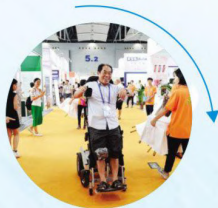
康复医疗及辅助器械