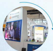
养老机构及护理服务